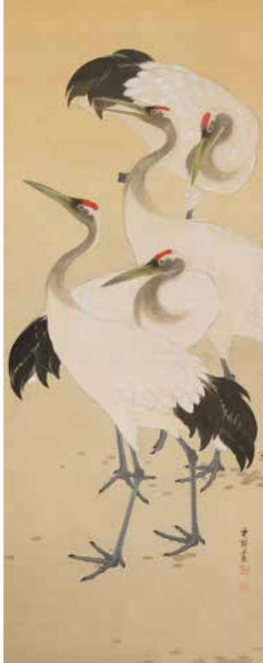
池上秀畝《群鶴図》制作年不詳 絹本着色

三重県松阪市魚町1807-1 〒515-0082 Tel.0598-21-1111