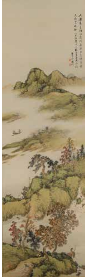
小室翠雲《青嶺天際飛帆図》制作年不詳 絹本墨画淡彩